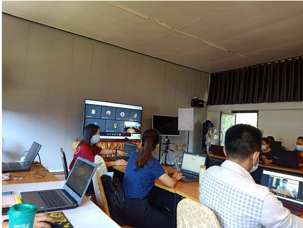
ภาพที่ 1 ภาพวิทัศน์ชี้แจงการประชุมผู้ปกครองออนไลน์

ในปีการศึกษา 2565 โรงเรียนอู่หม่าประชาสรรค์ ได้เปิดโอกาสให้ผู้ปกครองมีส่วนร่วมในการเสนอความคิดเห็นผ่านการประชุมผู้ปกครองออนไลน์ และวิดีโอวิสัยทัศน์ ตลอดจนมีส่วนร่วมกับชุมชน ในตำบลอู่หม่า อำเภอธาตุพนม จังหวัดนครพนม